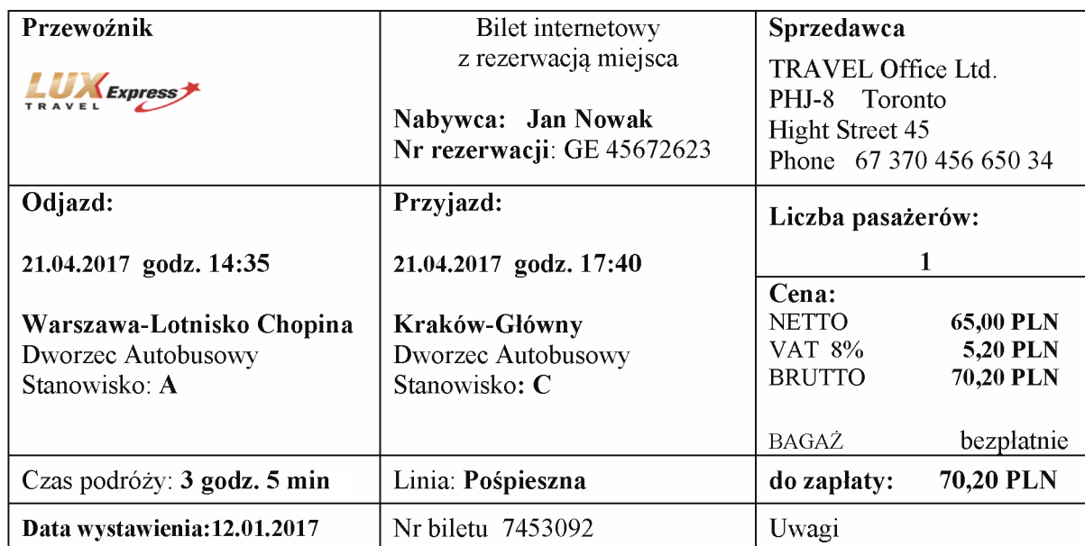
Tabela 3. Wydruk internetowej rezerwacji biletu autobusowego

Na trasie: Toronto-Warszawa różnica czasu 6 godzin